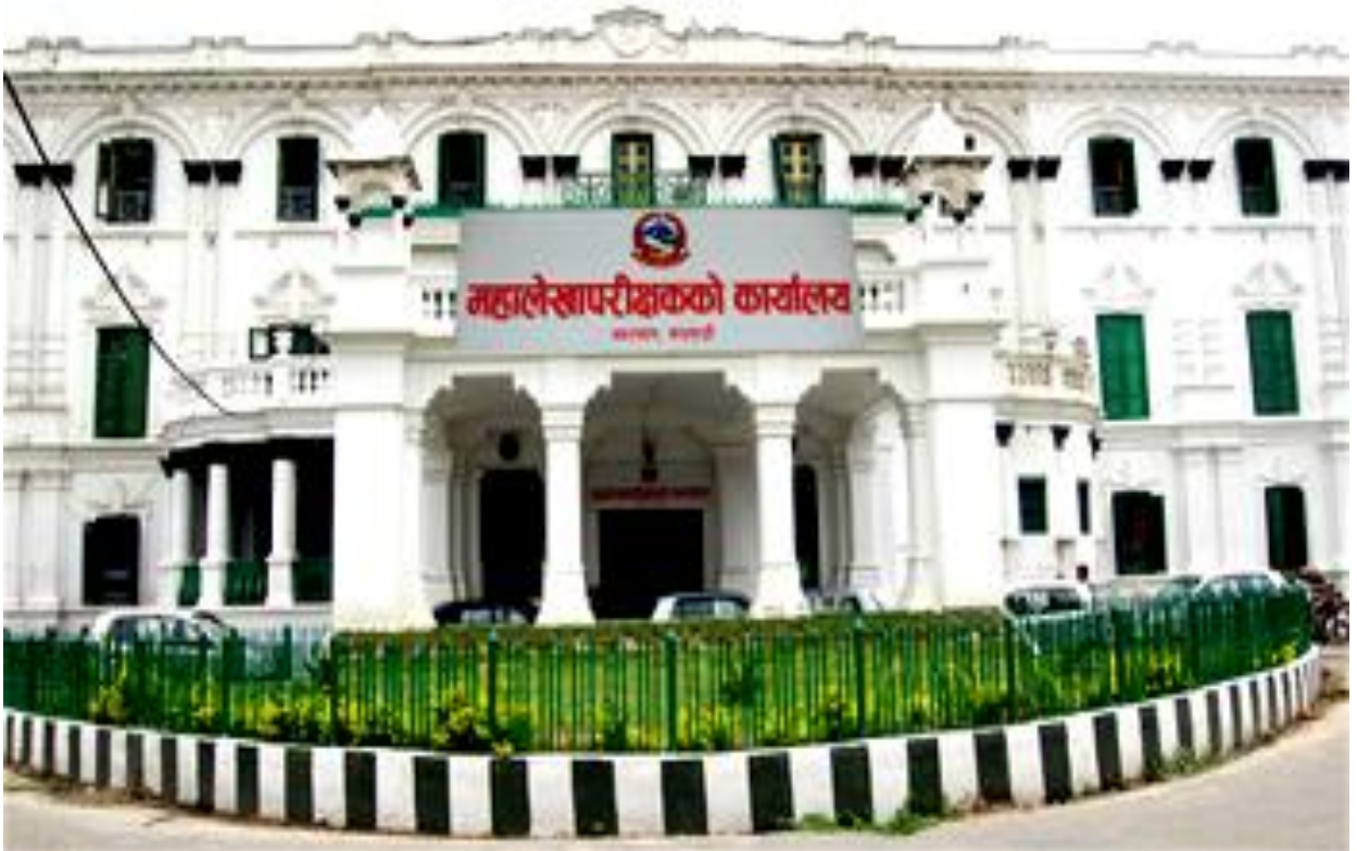
महालेखापरीक्षकको कार्यालय काठमाडौं, नेपाल